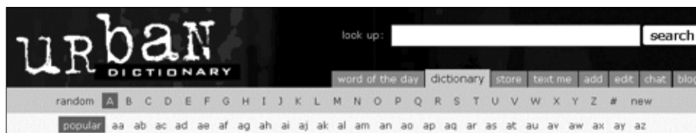
1. ábra: Szókeresés az Urban Dictionary weboldalon

A szótár teljesen ingyenes, a szolgáltatást az oldalon megjelenő reklámok finanszírozzák. A szócikkeket maguk az olvasók írják, csak egy regisztráció szükséges hozzá. A szótárszerkesztői feladatokat is bárki végezheti, önkéntes alapon. A minőségellenőr szintén az olvasó. A regisztrált felhasználók szavazataitól függ, hogy egy-egy újabb definíció bekerül-e a rendszerbe. Ekképpen szűrik ki a kéréstlen reklámokat, a hibás és téves szócikkeket.